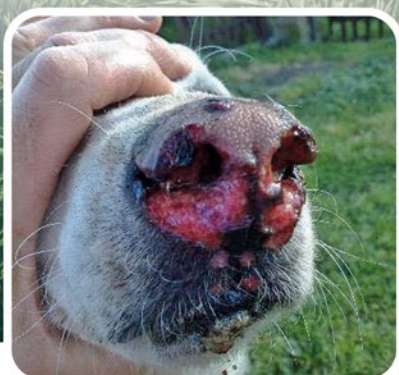
Effetti del contatto con i peli urticanti delle larve sul naso di un cane.